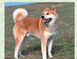
Ит – собака