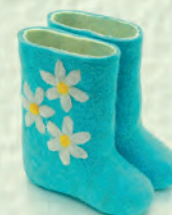
Кийиз этиклер – валенки