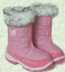
Исси этиклер – тёплые сапоги