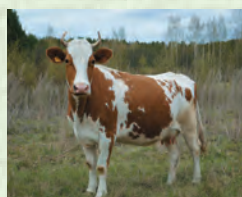
Сыйыр – корова