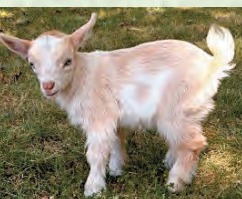
Гидив, улакъ – козлѐнок