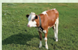
Бузав – теленок