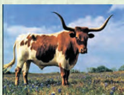
Оьгюз – вол