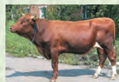
Тана – бык