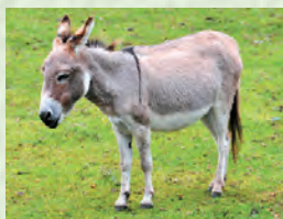
Эшек – ишак