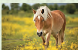
Ат – лошадь