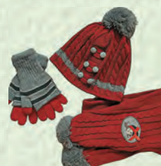
Бѐрк – шапка Къолгъаплар – перчатки Шарп – шарф