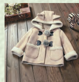
Тон – дублѐнка