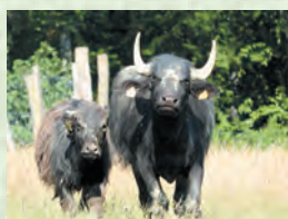
Гамиш – буйвол