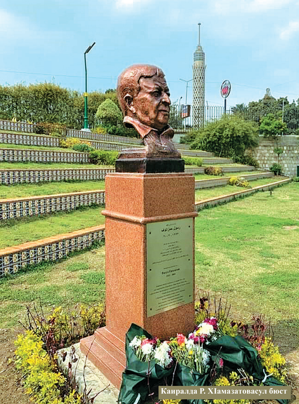
Каиралда Р. Хамзатовасул бюст