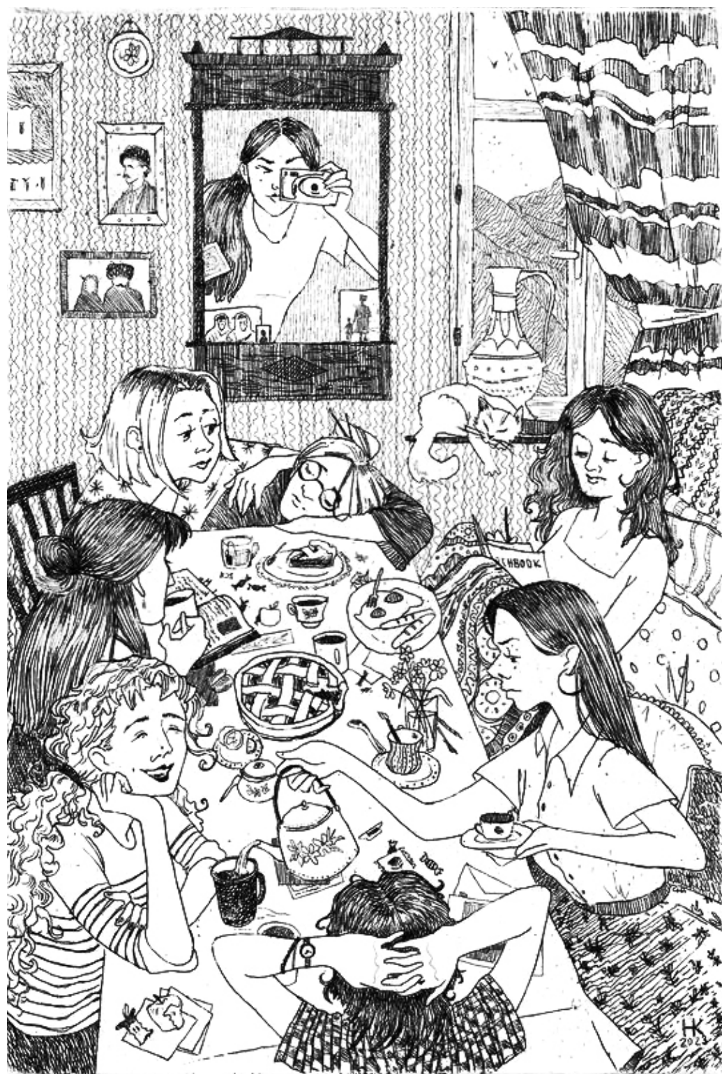
Нина Каймаразова. «Утро в горах». Офорт, травлёный штрих