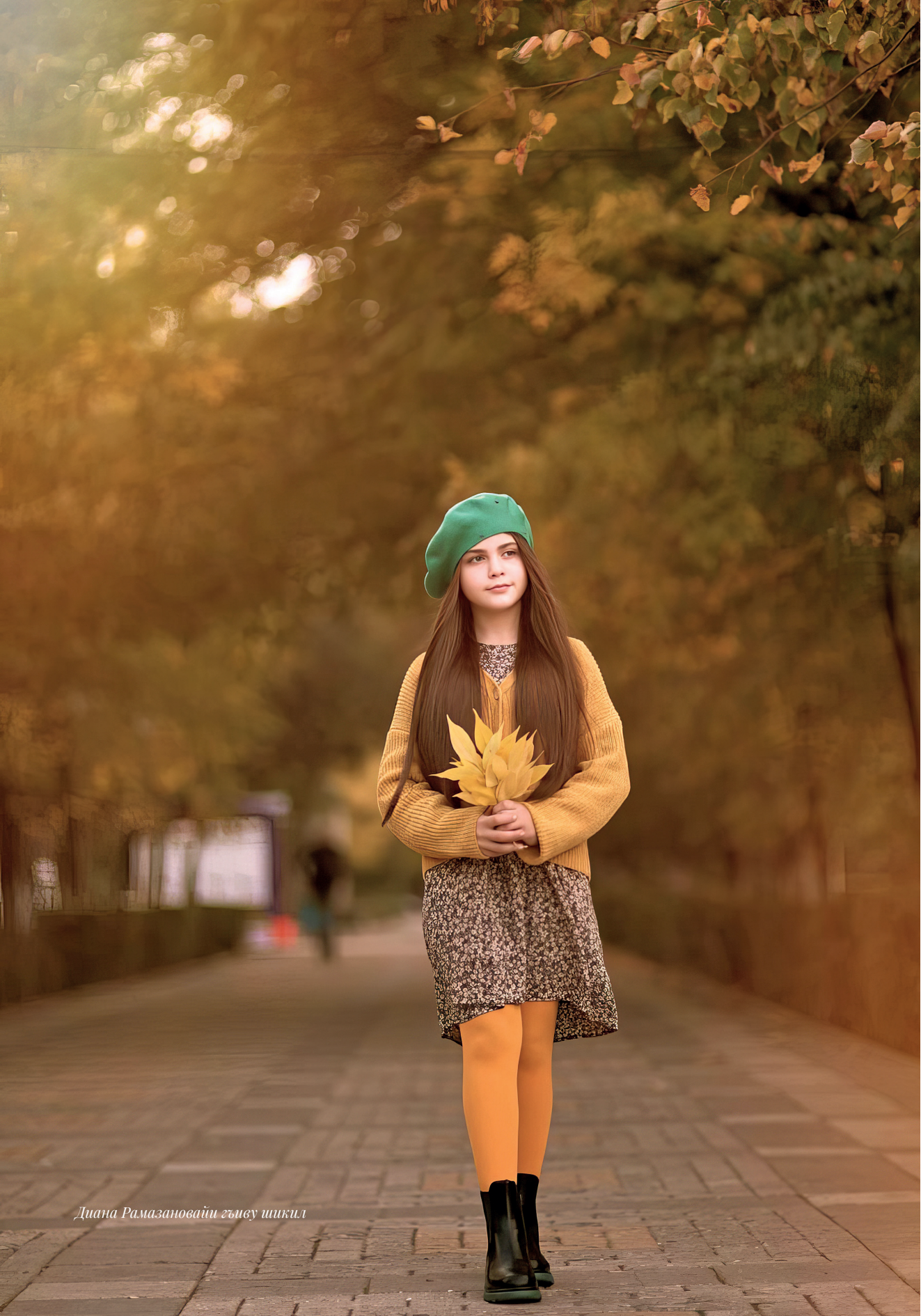
Диана Рамазановайн гэмүү шикил