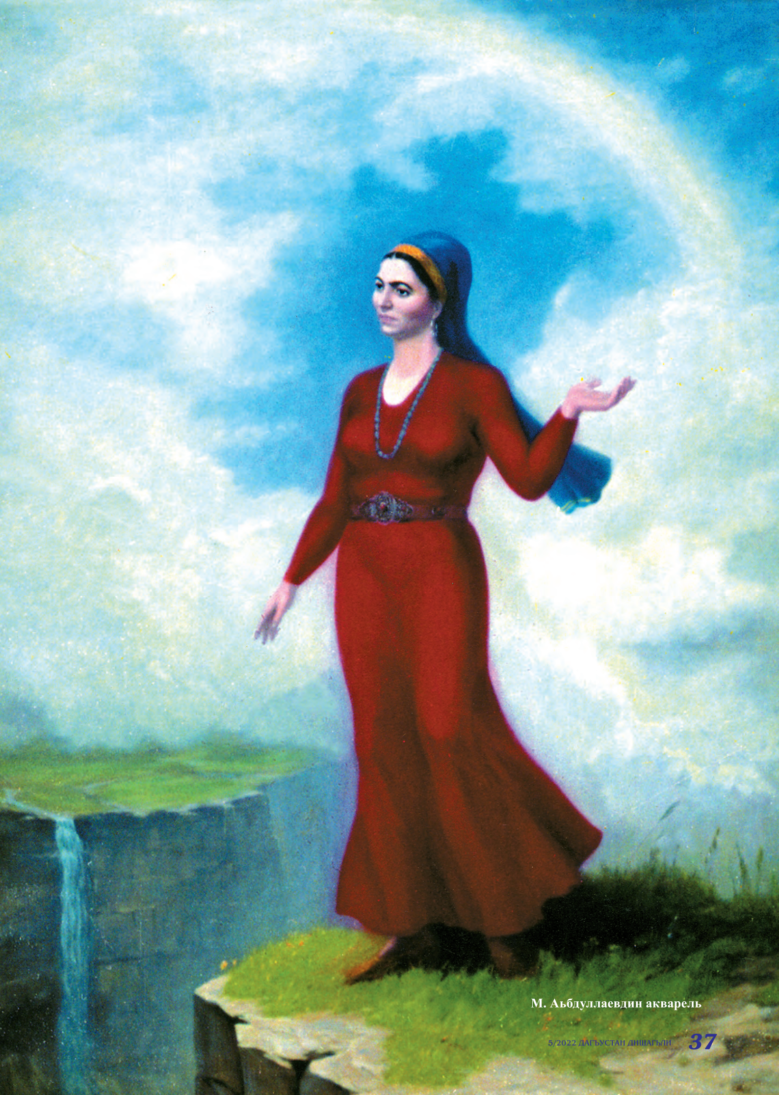
М. Абдуллаевдин акварель