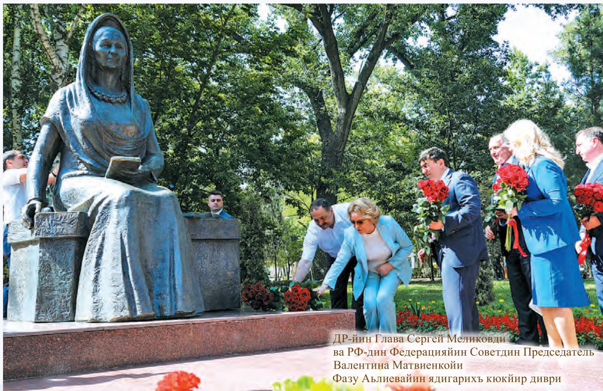
ДР-йин Глава Сергей Меликовди ва РФ-дин Федерацияйин Советдин Председатель Валентина Матвиенкойи Фазу Аблиевайин ядигарихъ кюкйир диври