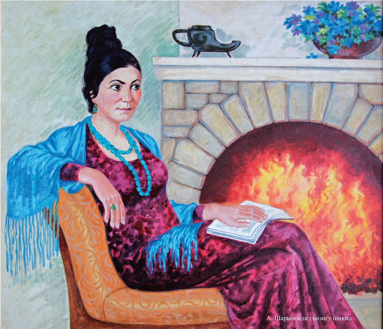
А. Шарыповди гъизигу шикил