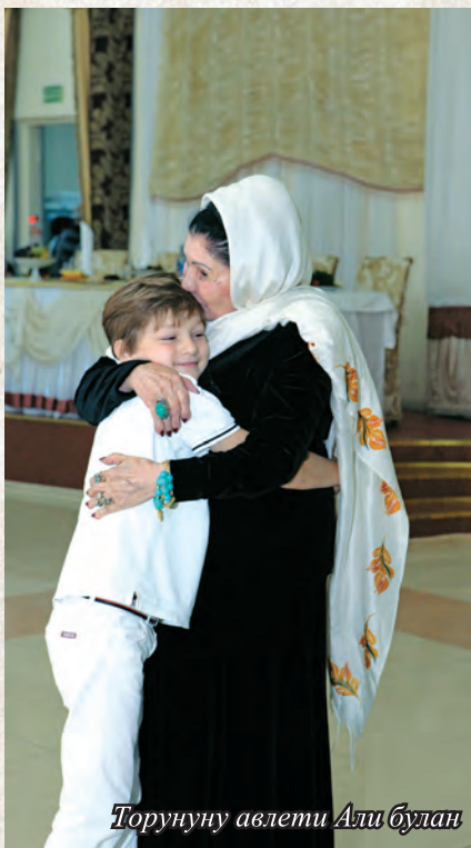
Торунуну авлети Али булан

Олахырынчы гюнлерине ерлиругъдан тюшмеди. Алда йимик гёзлери йыртыллай эди. Адабиятны, оъзюню сююмлю шаирлерини ва язвчуларыны гъакъында лакъыр чыгъып гетсе чи, авруву солкъ болуп, биз алдыбызда алдагъы Фазу анабызны гёре эдик. Узакъ ахшамлар къайсы буса да бир белгили асарны арагъа салып ойлашагъан кюйлерибиз бола эди. Шогъар байлавлу гъарибиз оъз пикруларыбызны айта эдик. Бирбирде мени къаравларым тезден берли токъташып гелген къаравлагъа къаршы чыгъа эди. Фазу мени пикрумну якълайгъанда бек сююне эдим. Шо адабият булан байлавлу ахшамлар бизде китап охувгъа даимге сюювню тувдурду. — Охумакъ аз,