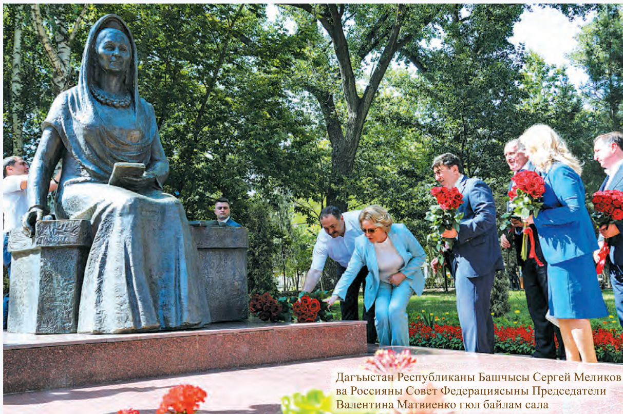
Дагъыстан Республиканы Башчысы Сергей Меликов ва Россияны Совет Федерациясыны Председатели Валентина Матвиенко гюл байлам сала