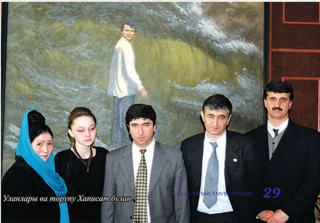
Уланлары ва торуну Хаписат булан