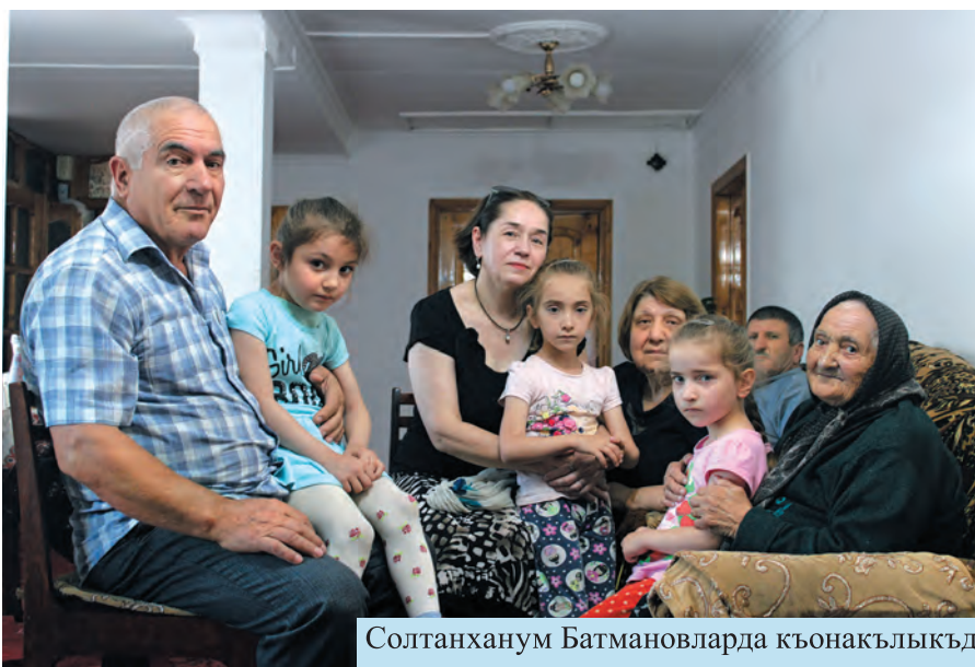
Солтанханум Батмановларда къонакълыкъда

2015-нчи йылны май айыны 15-нде ахшам сагъат бешде агъач къаравулчу оьзюню Курах райондагы участкасындайлана туруп, йылайгъан яшны тавушун эшите. Тавушгъа багъып юрюгенде, ол савутлангъан 6 адамны гѣре. Оланы алдында эргиши ва къолунда йылайгъан яшы булан къатынгиши тобукъдан тургъанлар.