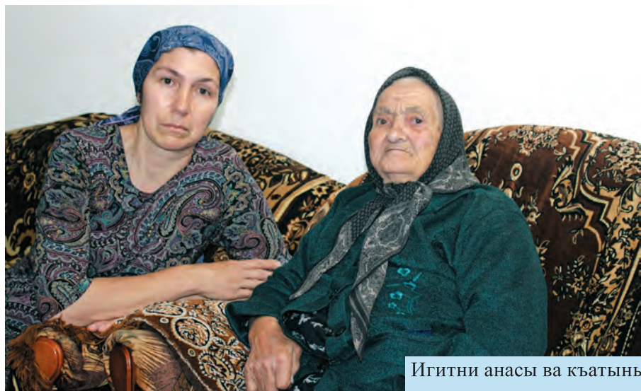
Игитни анасы ва къатыны

–Гъар иш-уый къуллукъ болсун, яшланы тарбиялав, сююнч яда къай-