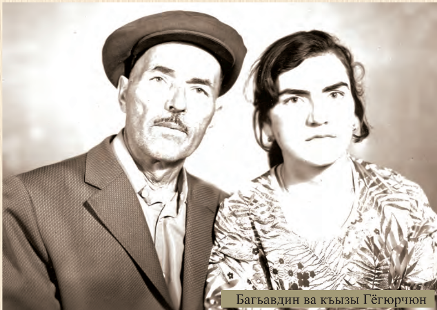
Багъавдин ва кызы Гёгюрчюн

Балики, озъюню тынглавсуз озъен йимикагъып гетген оьмюрюн гёзден гечире болгъандыр.