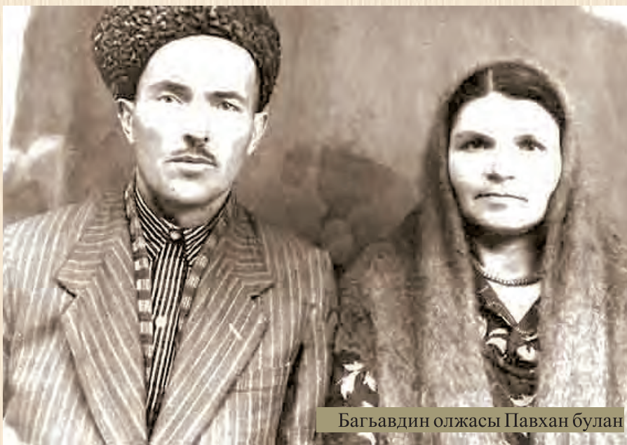
Багъавдин олжасы Павхан булан

Азат болуп, уйге къайтмагъа ихтияр берилген сонг, Атам ёлгъа тюше. Хасавюрт вокзалгъа етишип: «Мени бир адаммы сама савкъалганмы экен. Биревге де оьзюмню танытмай, тергев этип, адамларым ёкъ буса, гёзюм бакъган якъгъа гетежекмен», – деген ойлар булан юртгъа ёл сала. Тек шонда боташ-юртлу улан огъар шекли къарап: «Сен Багъавдин туюлюмюсен?» – деп сорай. «Дюрмен!» – дей Атам. Къайдан гелгенин де билмей бары адам жыйыла, Атамны къучакълайлар, гётерип оьрге чоелер, бир-бирине сююнчню айтып къычыралар ва йыбав-той булан дегенлей юртгъа алып гелелер.