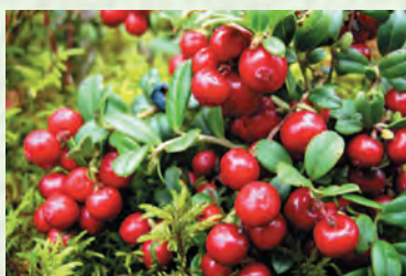
Мямрачи мешути цедеш - клюква