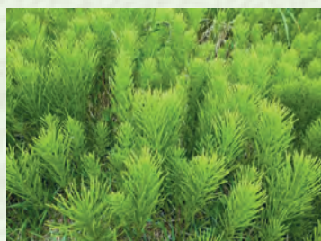
Бурбунар галга (буреба кІапІи) – хвощ