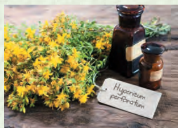
БухъутІа вава (чайліс пайдаладирути къар) – зверобой