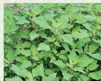
ШинигІя, арціи къар – лебеда