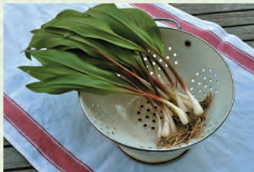
СусапІ гІятури – дикий лук