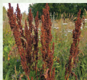
ГІява хІяхъли, гулуси – конский щавель