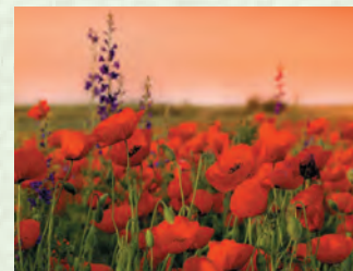
РайхІян вава – мак