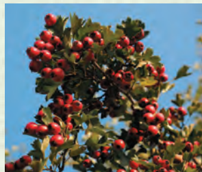
МяхІяула – боярышник