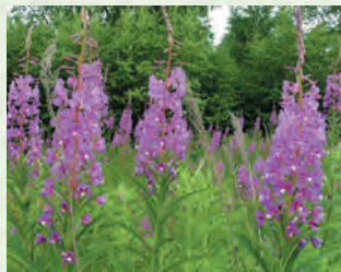
ДухъуцІа ва манавша рангла кІапІрала бегІ- кипрей, иван-чай