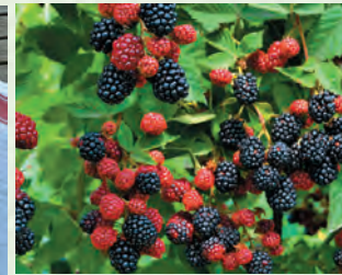
Чадури (къадала цедеш) - ежевика