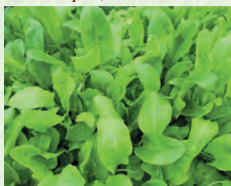
Мижа – щавель