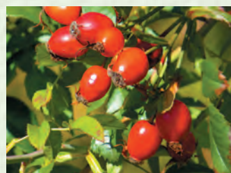
Мижигъар, низгъари (гІинтІ) – шиповник