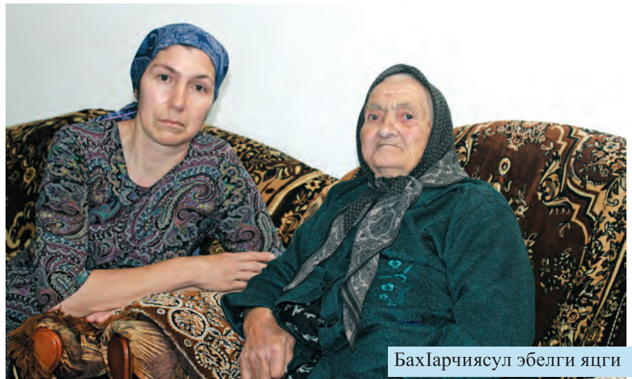
БахӀарчиясул эбелги яцги