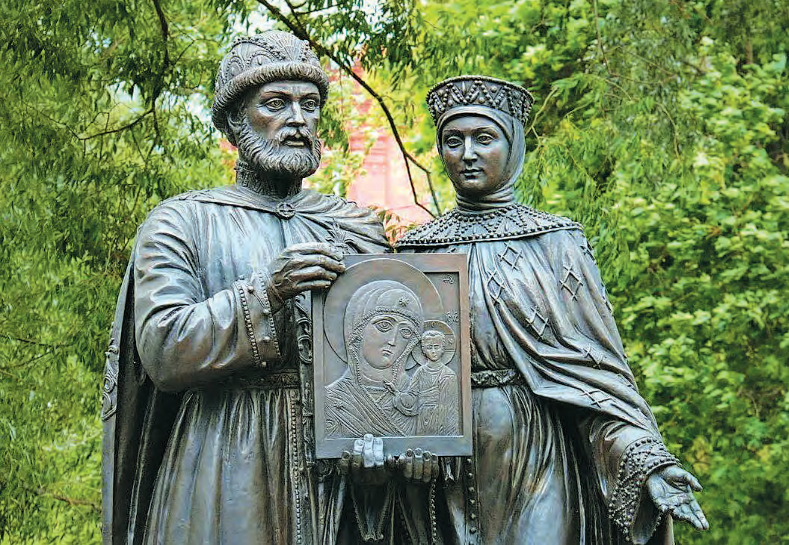
Памятник Петру и Февронии в г. Сергиев Посад