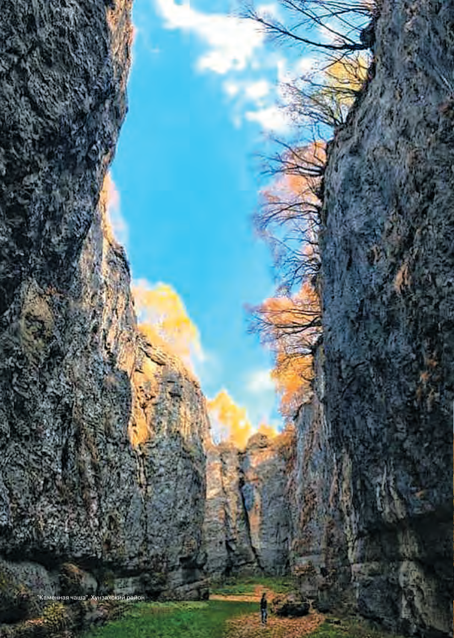
"Каменная чаша". Хунзахский район