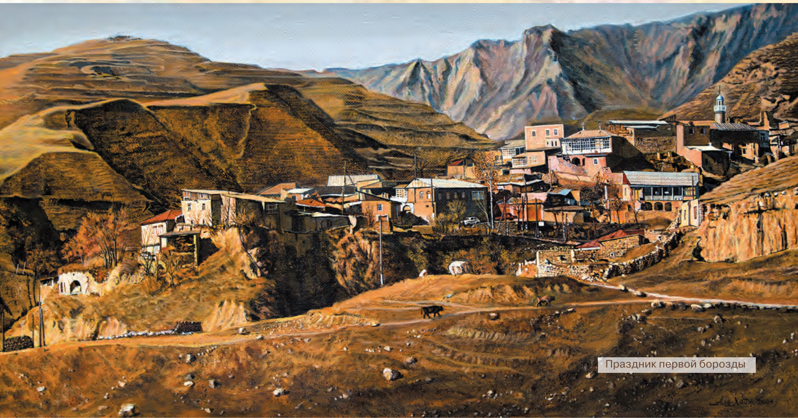
Праздник первой борозды