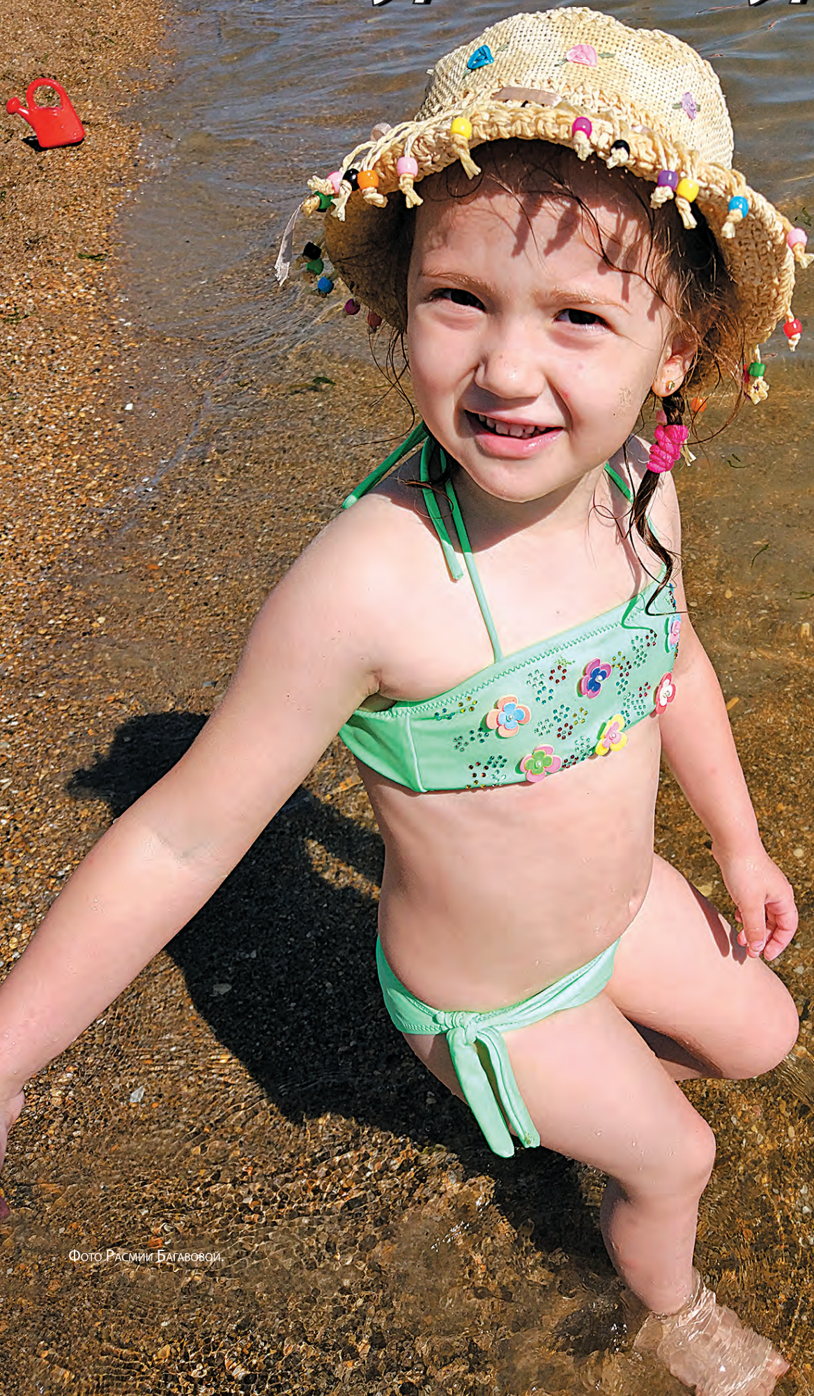
Фото РАСМИИ БАГАВОВОЙ