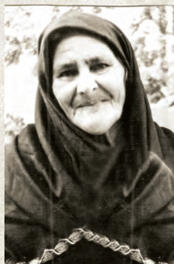
Назарова Нигар Шерифовна (1910 – 1986)

Чан хендедар, чан чи дидеяр! Къванериз ая куьне дердиар! Шумуд кас яраб хъанатѹа гъелек, Аллагъдикайни тахъана куьмек?! Мидад хъайидаз авур куь алхиш, Нагъакъан касдиз гайи ах-къаргъиш, Рикѹел хкана къуртѹа гъисаба Куьн экъечѹай къван вацѹар, гирдабар, Пар кѹула аваз атѹай къван рекъер, Чара тахъайла, куь шелни, куь хъвер, Тешпигъ авачир, куьн чи дамах я, Къенин несилдиз бегъем са мах я.