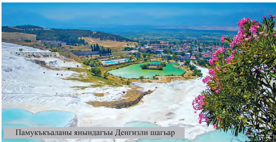
Памукькъаланы янындагы Денгизли шагъар

Ондан къайры да, археологлары ахтарывларын сонг бырынгъы грекдени о заманларда айтылгъан балыкъчысы Файносу вилласыны гесеклери сакълангъаны ачыкъ этилген. Ол бек бай адам болгъан. 1420-нчи йылда Осман империяны къолуна тюшгенде шо шагъар Ментеше санджакны административ центры бола. Тюрк республикасы къурулгъанда, шону аты алышынып, Мугла деп юрюле. Севиле хабарлагъан кюйде, бу шагъарда 1344-нчи йылда къурулгъан Уллу межит сакълангъан. Олай да, 1495-нчи йылда, къурулгъан Куршунлу межит, дагы да XVIII асруда янгыртылгъан Конакалты Хан ва Ягджылар Хан деген караван-сарайлар айрыча ерни тута. Оланы бириси—сурат галерея, экинчиси сатыв-алыв учун къоллана болгъан. Мугла шагъарны эски кварталыны тавтюп боюнда, Сабурхан деген майданыны янында XVIII-XIX асрулардагы 400-ге ювукь уйлер гысапгъа алынган. Аслу гъалда шолар—османлыланы, тюркдени стилинде ишленген уйлер. Шоланы кёплерин ярашдырып да туралар. Бу ерде эсгерип къойма сюемен, тюрклер бырынгъы эсделикге оьтесиз абур эте, оланы янгыртып сакъламагъа да къасткъыдалар.