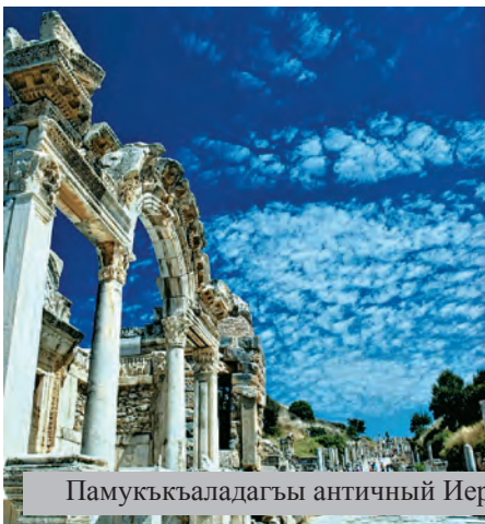
Памукькъаладагы античный Иерополис шагъарны къапулары