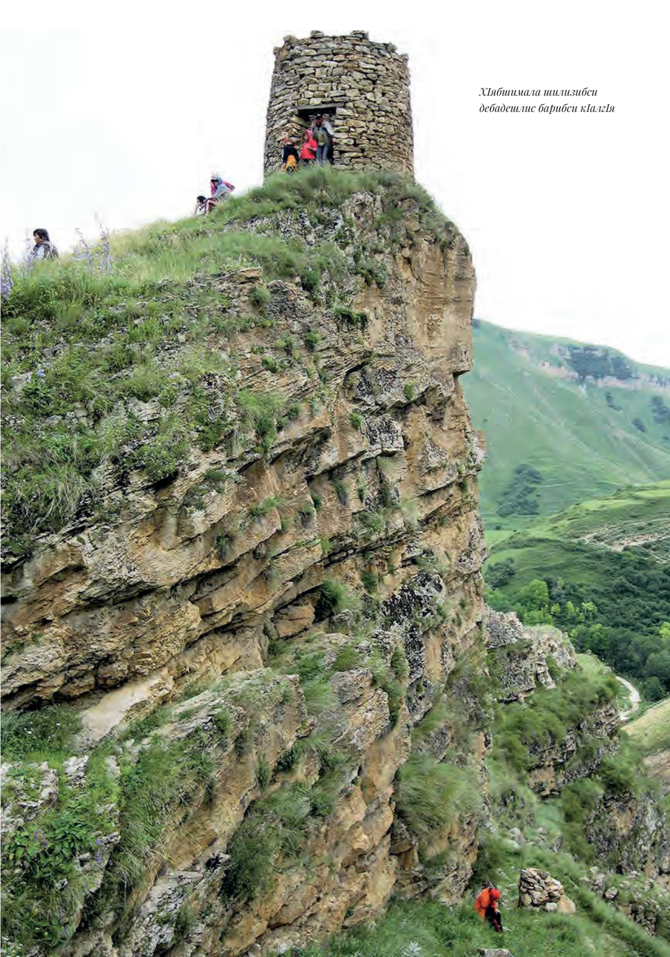
Хябшмала шилизбси дебадешилс барибси кIалгIя