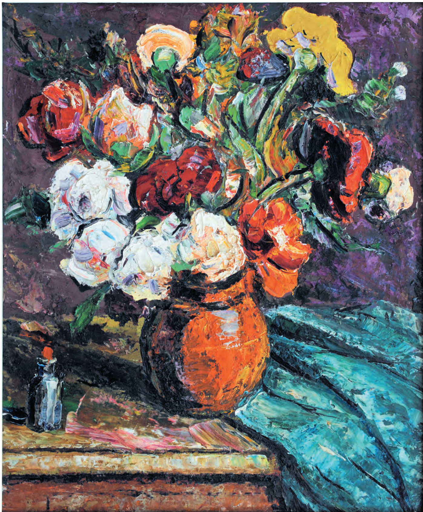
Августович Алексей Иванович. Натюрморт «Цветы», вторая половина XX века, холст, масло, 60,5x50 см, КП-12649, Ж-1185