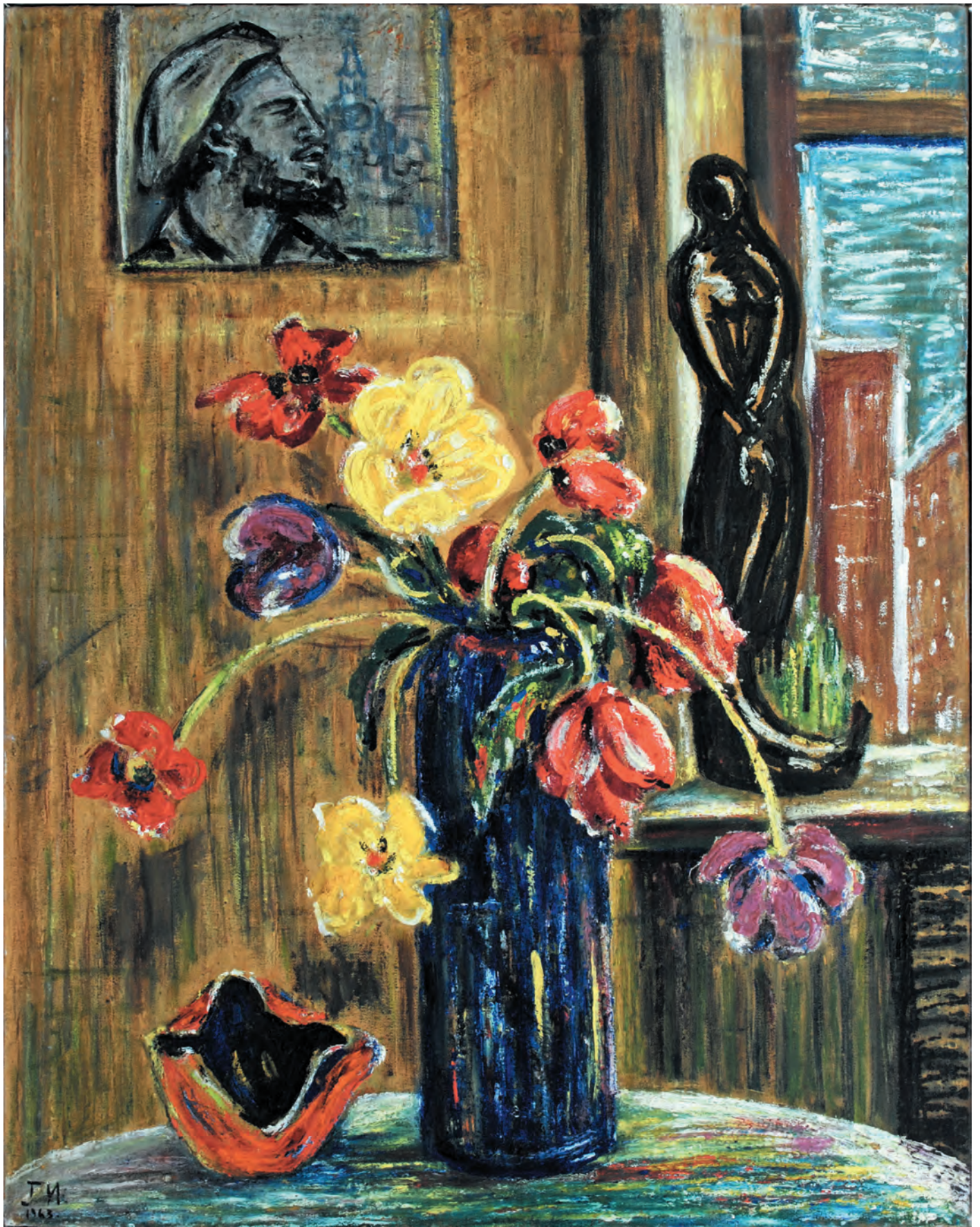
Иранпур Гюлли. Весна с портретом Ф. Кастро, 1963 г., холст, масло, 80х60,5 см, КП-4127, Ж-321