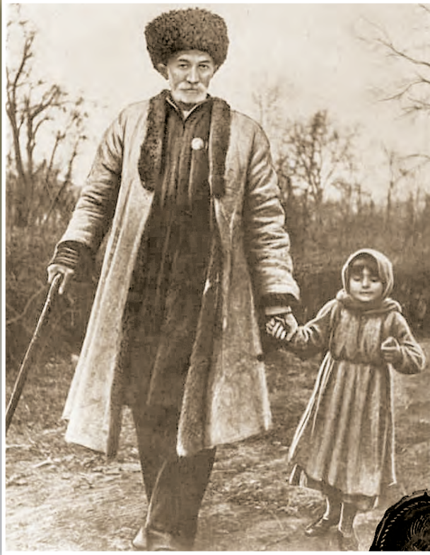
С. Сулейманан хтул Мариятахъ галаз