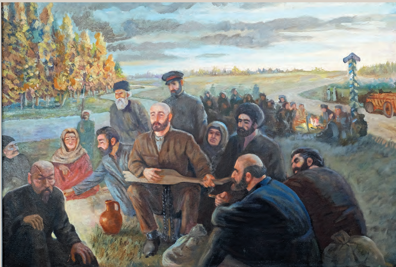
Юнусилау М.-К.М. (1907–1975) Ирчи-Казак, холст, масло, 52x86 см