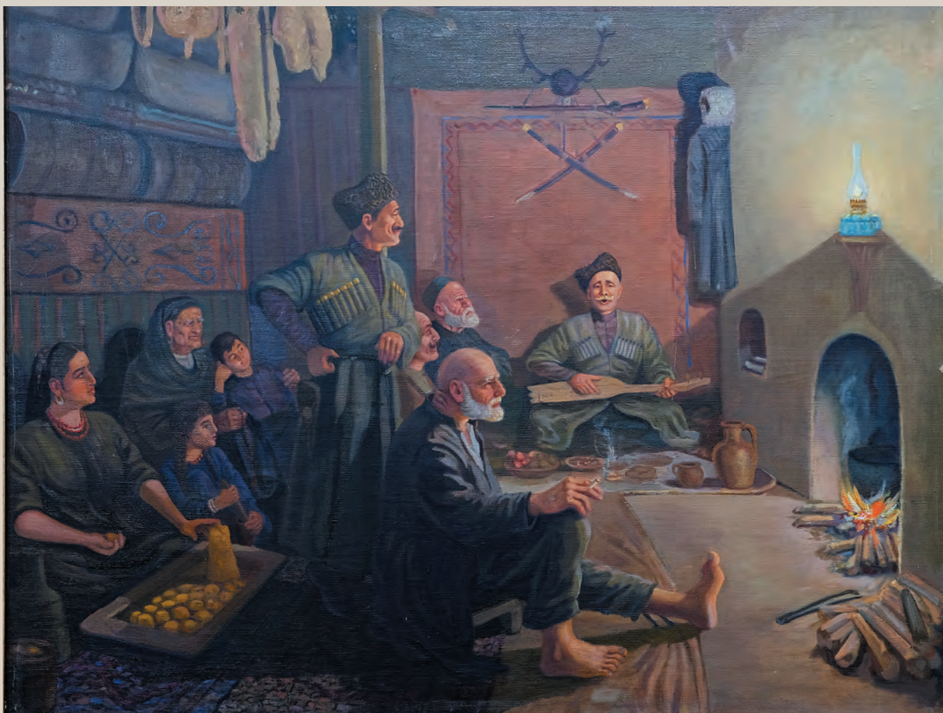
Юнусилау М.-К.М. (1907–1975) Махмуд в сакле, 1958 г. холст, масло, 88x110 см