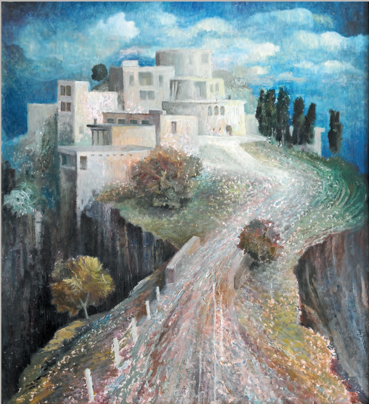
Юнусилау К.-М. М. Полдень, 1989 г., картон, масло, 47x42 см, КП-12638, Ж-664