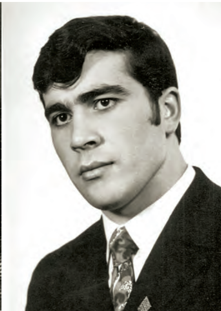
Жагъхели касибти суратуни

Р ахъхи сарри нуни халаси хурмат бирус ва вигахъуси адамличила белкес дигули. Ил сунечила белкесра лайикъси адам сай. Гъай Махяммадов Ражаб Махяммадовичличила сари. Ригахъис наб илала хъунул Батара – гяхъиси неш ва пергер хъунул сари или гибратлис рурес виар илра. Адамтала хурмат бирес балухели саби, илдани чулара халаси хурмат бирус. Илдачил биубси дила гъарил ихтилат бахъхи хъумуртули херирус. Батанира акъули замана буркълули херирар, бирусилчи чекаризурси ва иштхиличил бирус адам сари. Адамлис гяхидеш барес бикалли разибирутазирад сари. Илала бахъал гяхити балликъянабира леб, ил сариван адамтачи дигичебти.