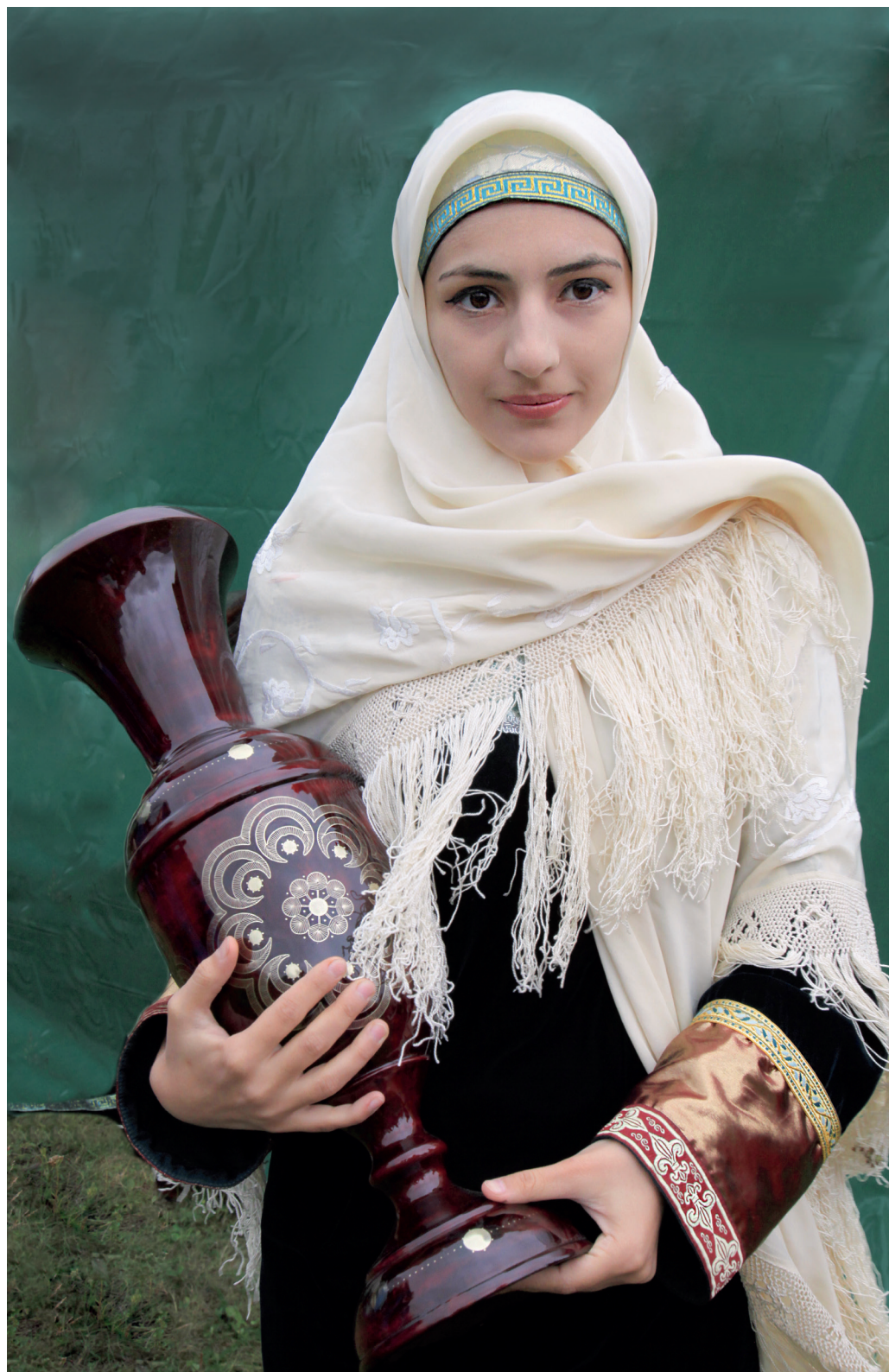
Из Унцукуля.