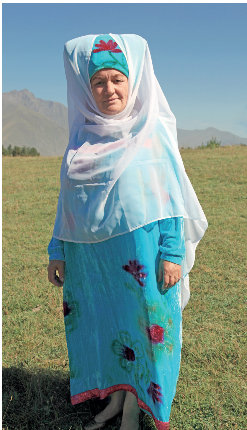
Гандисей. К. Чутуевасул сурат